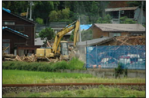
一週間後の倒壊建物の片付