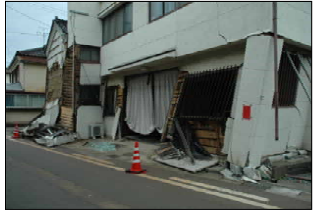
前面壁無しの店舗形式