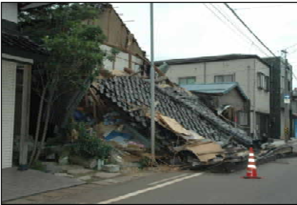
完全倒壊で屋根面のみ残る