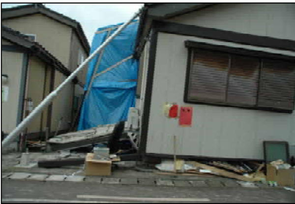
軽量角柱の2階建1階が倒壊