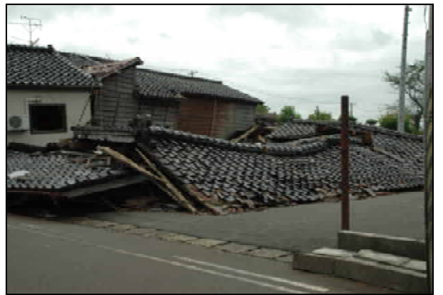
完全倒壊屋根面のみ残る