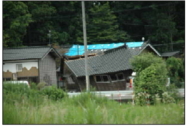
平屋住宅の傾き被害