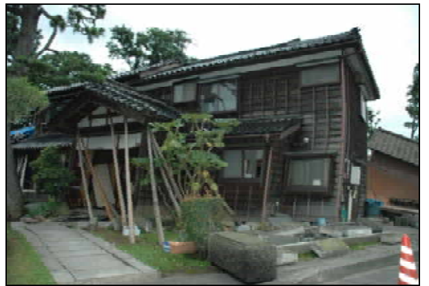
傾いた建屋を丸太で支えている