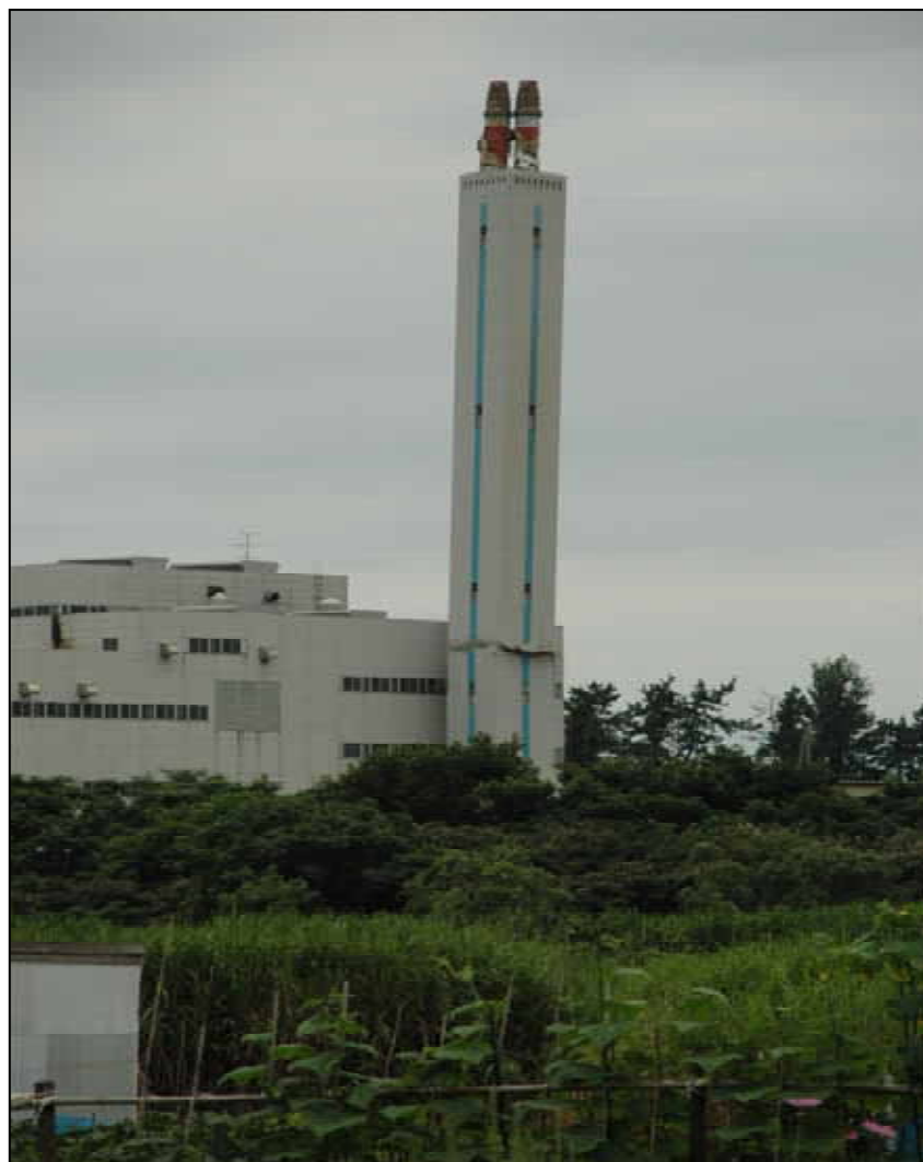
清掃工場の煙突被害