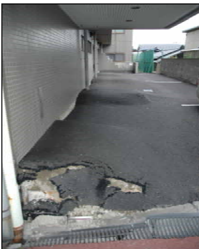
敷地内駐車場不同沈下