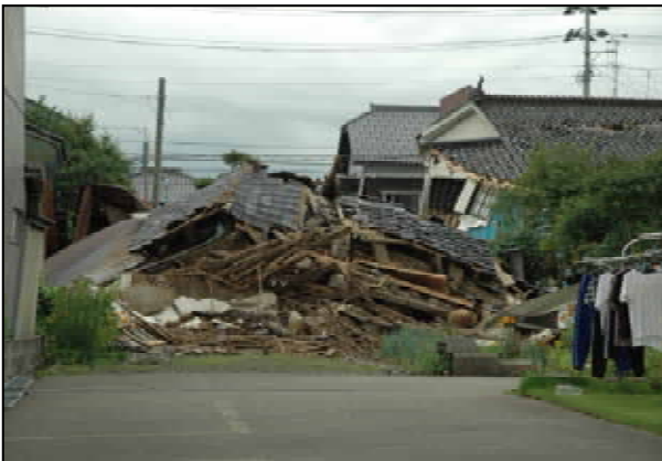
全体崩壊屋根面も破壊