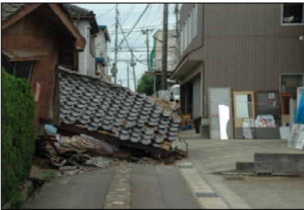
道路をふさいだ倒壊建物