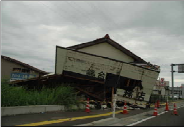
1階の片側が圧壊し傾く