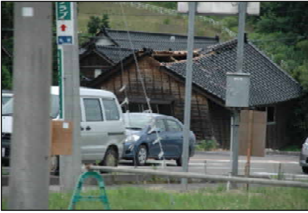
刈羽村戸建住宅被害