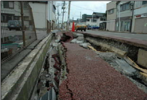
歩道の陥没段差 70cm 位