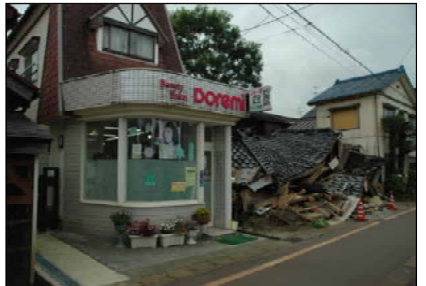
左右の建物は無被害