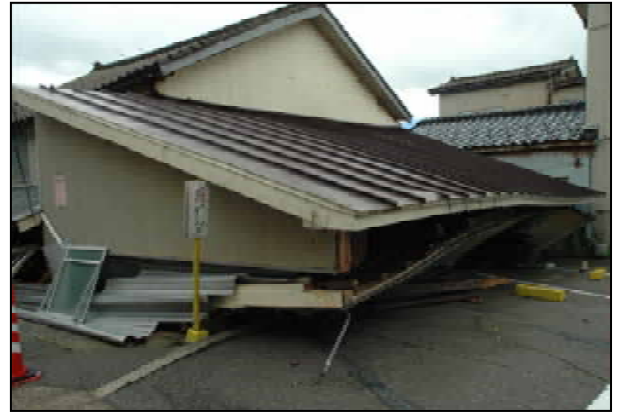
1階が倒壊、2階が残る