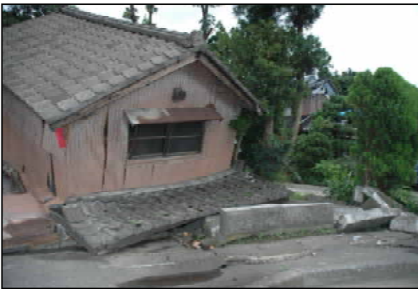
1階が倒壊して2階が残っている