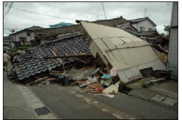
完全倒壊左の建物