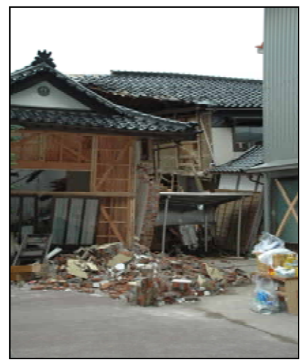
社寺建築、中越地震で補強済