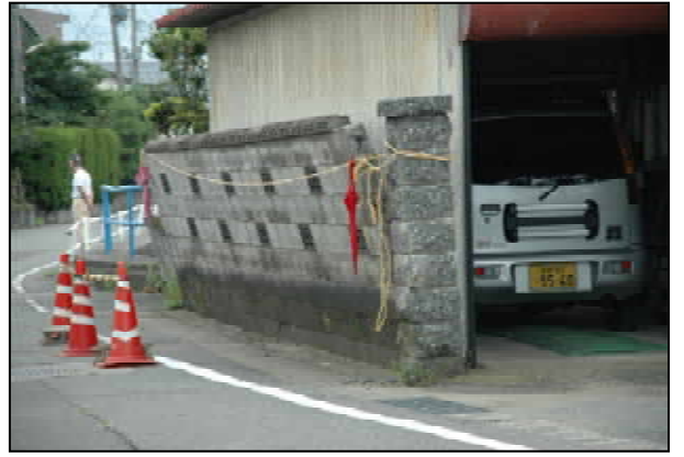
ブロック塀の倒壊寸前