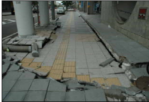
歩道の段差、舗装ブロックの破壊