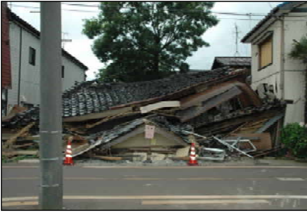
倒壊建物がぶつかり損傷