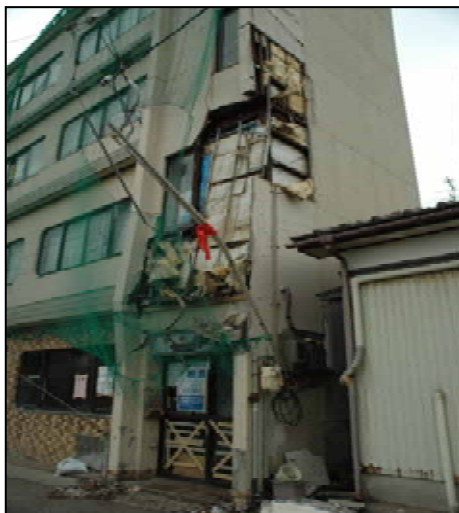
4階建鉄骨造の外壁被害